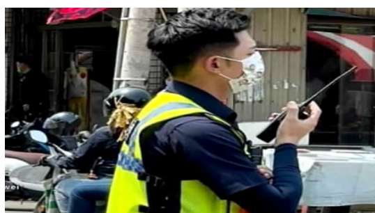
熱血報考警察 家戶訪查"敲錯門"

曾在台中市政府警察局烏日分局服務的員警賴 00，外型與能力皆相當出色，卻因執勤時「訪查走錯戶」，遭住戶控告侵入住宅並索賠百萬元，這起事件讓他背負莫須有罪名長達八年，身心俱疲。