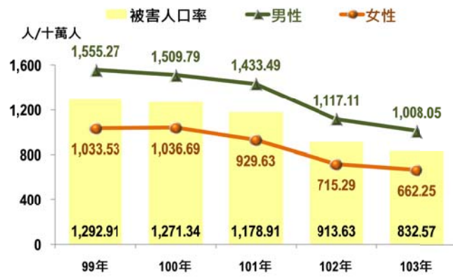
圖1 新北市全般刑案兩性被害人口率

與六都相較，本市 99 年至 101 年全般刑案被害人口率均在六都中位居第 3 高，自 102 年起則退居第 4 高，顯示本市警察人員在防制犯罪被害上的努力，已稍具成效；本市近 5 年來被害人口率均低於臺北市，而桃園市則均為六都最低，依 103 年資料顯示，本市每十萬人有 832.57 人被害，低於臺北市 1,268.70 人，但高於桃園市 532.38 人；就性別觀察，排名結果亦同上。(表 2)