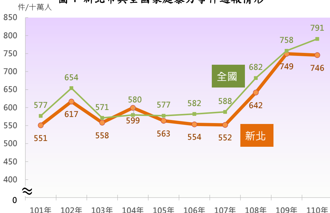
圖 1 新北市與全國家庭暴力事件通報情形

另觀察本局占全國通報發生案件比重，近十年呈上升趨勢，110 年達 9.36%最高，顯示本局基於「婦幼保護」係治安重要的務本工作，全力救護家庭暴力受害民眾，使其免於生活恐懼。為加深民眾防治家暴印象，本局