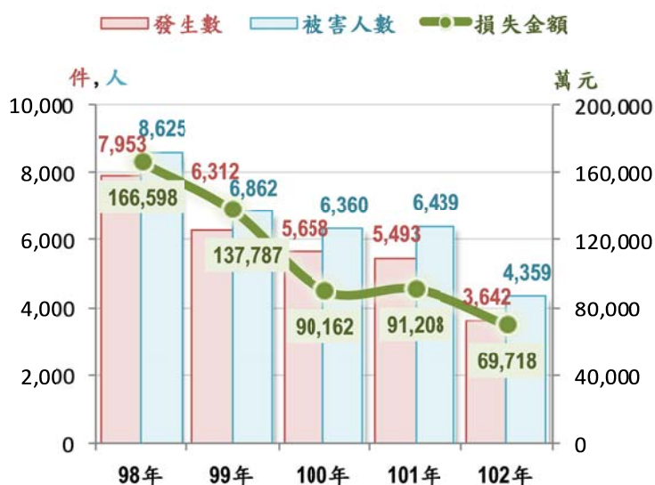
圖 1 近 5 年詐欺犯罪概況